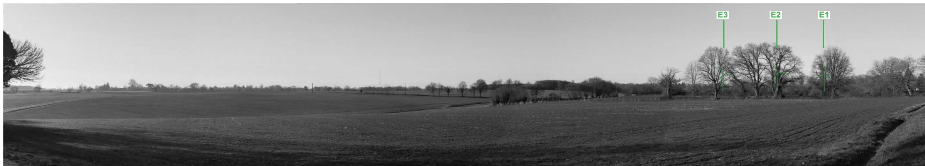
Vue panoramique noir et blanc avec esquisse du projet (angle de vue 120°)