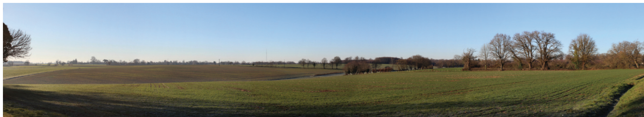
Vue panoramique de l'état initial (angle de vue 120°)